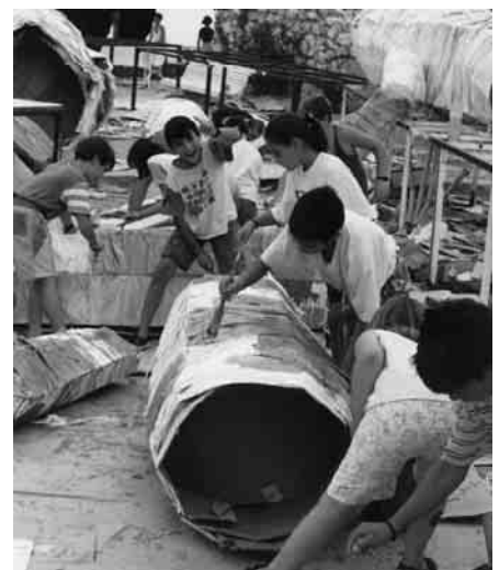
Participando na montaxe.