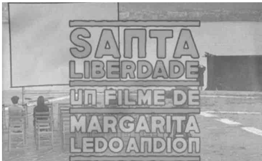
Cartaz do documentário Santa Liberdade

A construçom do filme vai-nos levando polos diferentes protagonistas, alternando os próprios participantes com familiares que ficárom à espera. Dentre a família dos revoltados, destaca o papel das mulheres que tenhem que ficar, estranho papel para elas, a tomar conta dos filhos e das filhas, à espera do resultado. Umha anciá, viúva de Soutomaior, recompom o episódio numha intervençom cheia de ternura: lembra como foi convidada a fugir com o homem e como renuncia