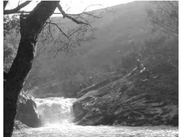
Torrentes de Mácara

gadoupas dos intereses económicos dos "violadores e destrutores da máxima paisaxe rumorosa. Inemigos da vida e da beleza", que diría Manuel María.