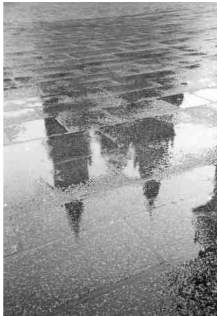
Compostela, por Mari Vega

(...) Non podemos negar que se foron conseguindo verdadeiros cambios tanto