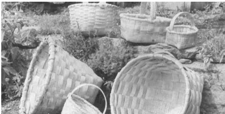
Os cesteiros de Mondariz empregan unha xerga propia

(...) O oficio de cesteiros dá ós que o practican un certo ar de superioridade con relación a outros obreiros, xa que constitúen un xeito de gremio, incluso co seu lingoaxe propio, a verba dos cesteiros (...) fenómeno frecuente entre as xentes de oficio que supoña traslados continuos (...).