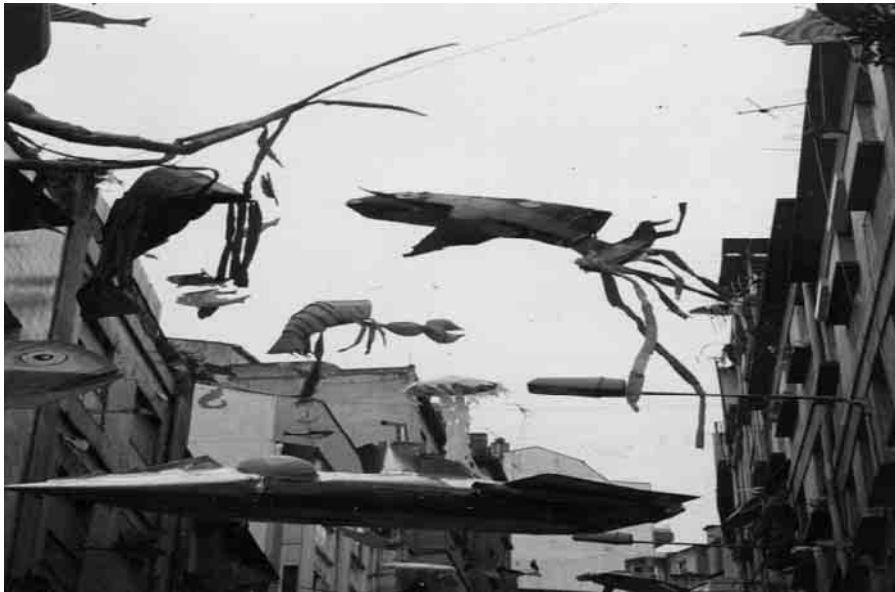
Fotografía dunha das montaxes