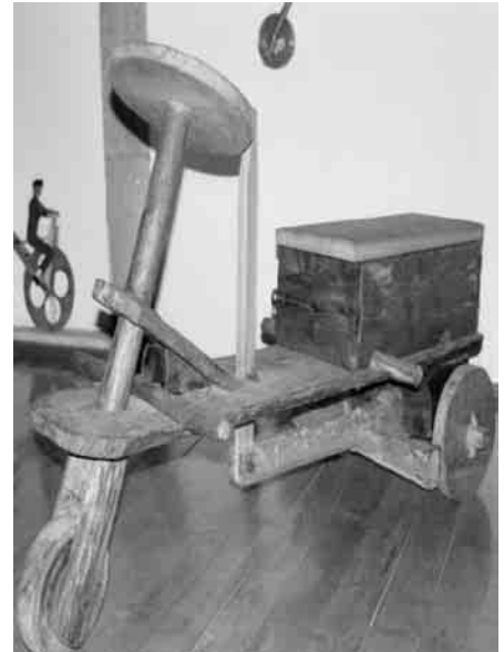
Carro de tres rodas.

Comezamos a nosa andaina xa hai uns oito anos, aínda que sen un obxectivo concreto e si con moitas ganas de procurar e remexer no pasado. Empezamos a falar cos máis vellos do noso entorno do concello de Lourenzá, aló no norte da provincia de Lugo, na comarca da Mariña Central e pegada ás "terras de Miranda" cunqueirianas. Iamos, devagariño, anotando como se construían, que material cumpría para a súa realización, cando se xogaba ou a época en que se realizaba. Unha vez feita esta recolleita, procediamos á súa realización, probando sempre o seu funcionamento e posteriormente pasabamos ao seu debuxo. Logo, nesa ansia de coñecer máis, consultamos estudos feitos en